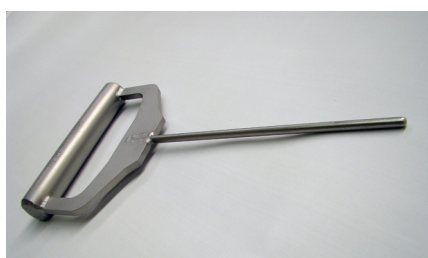
BFM® 'TR Release Tool'.

Konektory BFM® TR (tool release) 040E a 040AS mají identifikační značku, pro odlišení od standardních konektorů